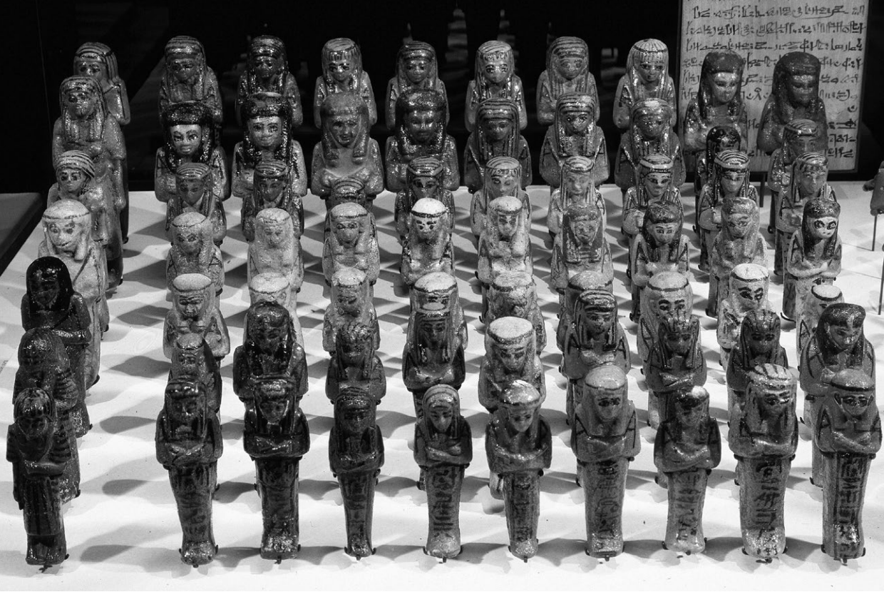
Несколько ушебти из гробницы Третьего переходного периода. Во главе каждой группы рабочих стоит десятник

в деревянный гроб, а иногда в несколько гробов, вставленных друг в друга. Мумии богатых египтян хоронили в каменных саркофагах.