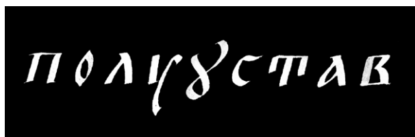
Рис. 2. Славянская письменность, тип «полуустав»