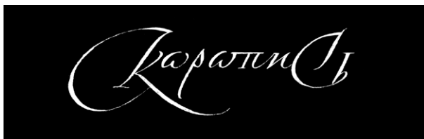
Рис. 9а. Скоропись позднего периода