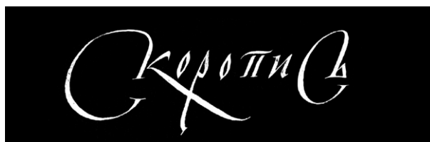
Рис. 8. Скоропись среднего периода