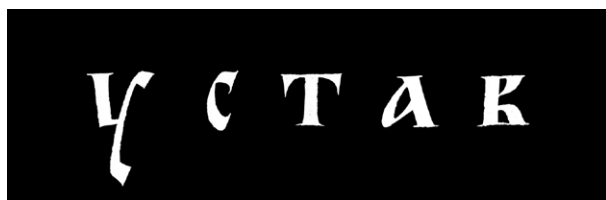
Рис. 1. Славянская письменность, тип «устав»

В уставе, например, элементы букв часто выводились в несколько приемов (рис. 5). Это так называемая техника составного письма — нечто среднее между каллиграфией и рисованием букв (см. раздел «Терминология»).