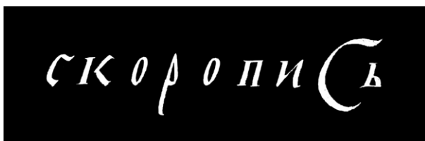
Рис. 7. Скоропись раннего периода