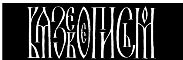
Рис. 3. Славянская письменность, тип «вязь»