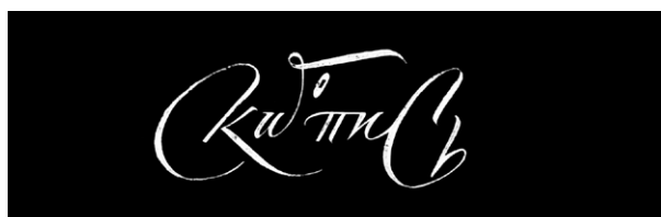
Рис. 9б. Скоропись позднего периода

В данном пособии мы покажем примеры различных исторических приемов скорописи. Многие из них используются дизайнерами и каллиграфами до сих пор, хотя и с упрощениями, чтобы сделать надпись более читаемой. Эти приемы придают жизни, свежести письму и дают возможность уйти от тех нелепых букв, которые мы так тщательно выводили шариковой ручкой в младших классах.