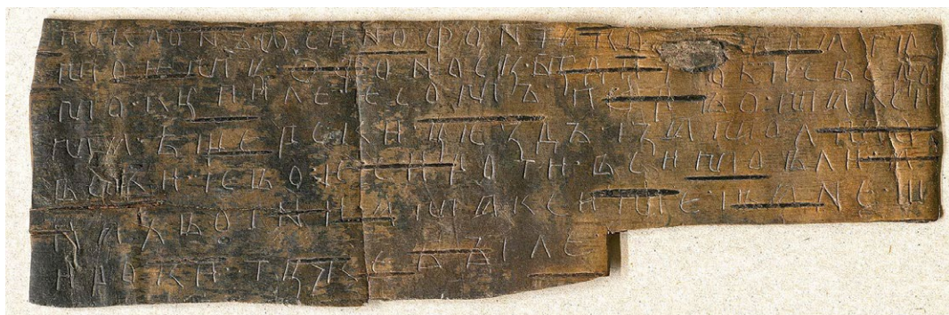
Рис. 6. Славянская берестяная грамота

в один дукт или способом составного письма, а рисовались все реже. Но в целом характер этого почерка стал свободнее. Возникла необходимость писать и переписывать все больше и больше книг, поэтому и потребовалась высокая скорость письма.