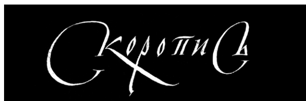
Рис. 4. Славянская письменность, тип «скоропись»