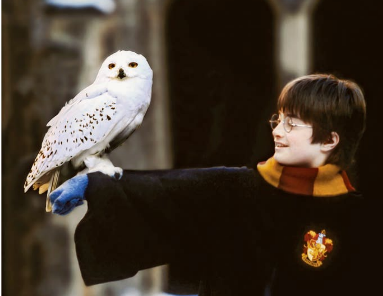
ВЫШЕ: Гарри Поттер и Букля. Кадр из фильма «Гарри Поттер и философский камень»