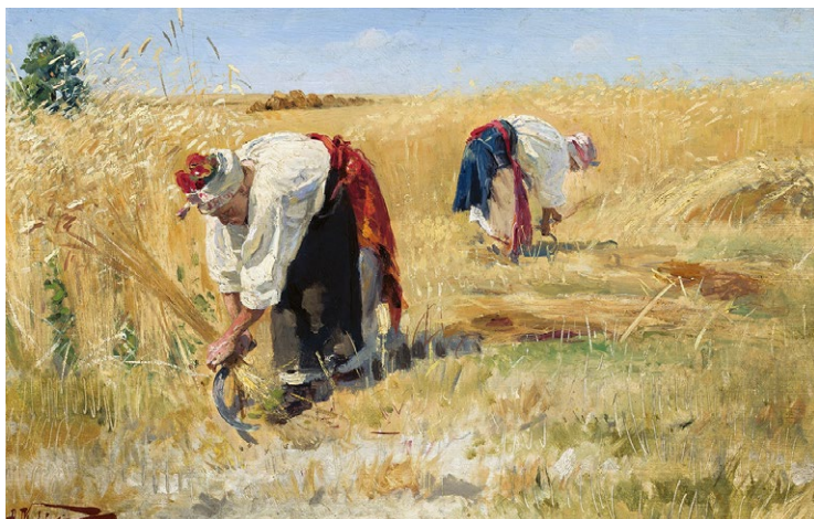
Жатва. Картина Александра Маковского. 1896 г.

ницы и хранительницы корешков, увидели ростки. Они осознали, что изначальное растение, уже непригодное для еды, сгнило, умерло — но взамен оставило после себя новую жизнь, подобную прежней. Наблюдения за природными циклами, за сменой фаз Луны, за тем, как плод дает семена, а семя пускает корни и преобразуется в новое растение, стали не просто любованием, а знанием. Появилось понимание того, что смена сезонов, дня и ночи влияет на рост и состояние растений. Посевы злаковых и первых огородных культур, а потом наблюдения за ними позволили осознать, что зерно, упавшее в землю, не погибает навсегда, ведь оно дает взамен множество других зерен или плодов. Оно лишь по виду мертво, но при этом продолжает жить в новых, произведенных от него растениях.