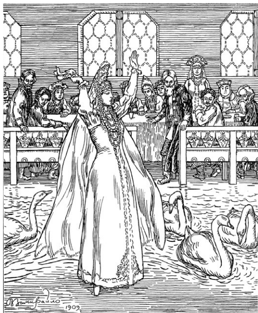
Иллюстрация Виктора Замирайло к сказке «Царевна-лягушка»

проходить посвящение. Утрата «маточного рая», родной пещеры, удаление от хорошо знакомых мест и домашнего очага вели к инициации, а инициация — ко второму рождению.