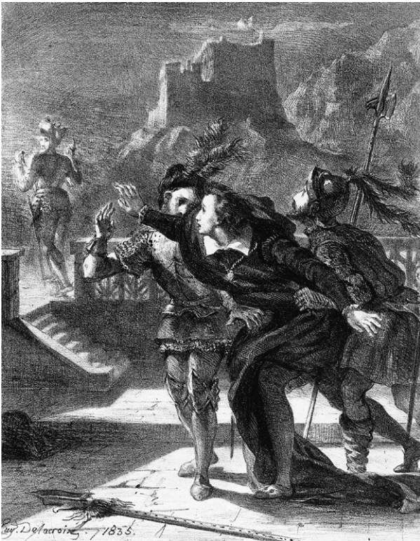
Гамлет пытается последовать за призраком своего отца

Написанная прежде всего для того, чтобы у нас с вами (у меня — в процессе письма, у вас — во время чтения) был повод поразмышлять о собственной культуре и истории. Искренне надеюсь, что мои рассказы доставят читателю такое же удовольствие, какое они доставили автору.