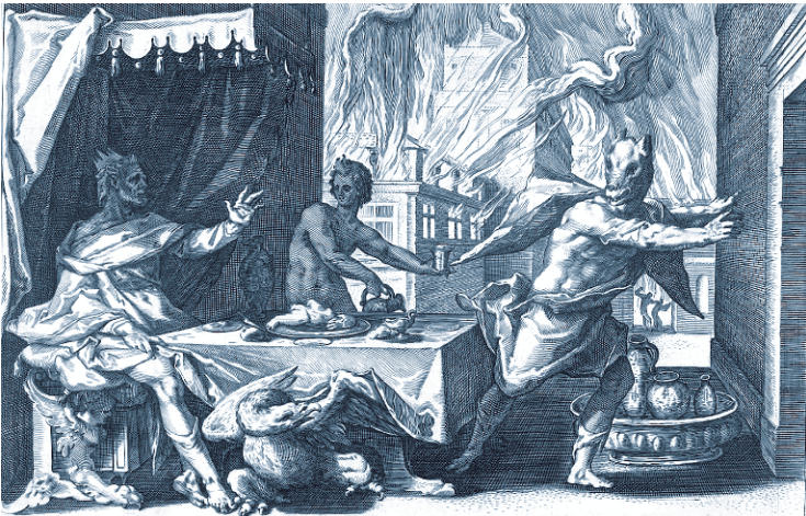
Ликаон, превращенный в волка.

Отношение к оборотням повсеместно граничило с паническим ужасом, хотя в ряде мест их, несомненно, не только боялись, но и уважали. Это больше касалось Северной