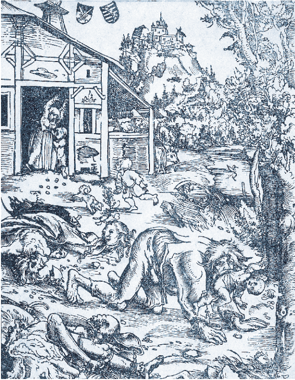
Оборотень. Гравюра на дереве Лукаса Кранаха Старшего

людей признаваться в самых немыслимых грехах. Так, в конце XVI века в разных европейских странах с ужасом передавали рассказы о суде над Петером Штуббе (он же Штумпф), прозванным Бедбургским оборотнем. Он признался, что превращался «в алчного кровожадного волка, сильного и могучего, с огромными глазами, сверкавшими как факелы в ночи, с большой и широкой пастью, полной ужасных острых зубов, могучим телом и мощными лапами» 3 . Естественно, после пыток и «добровольного» признания оборотня сожгли. И таких случаев было немало.