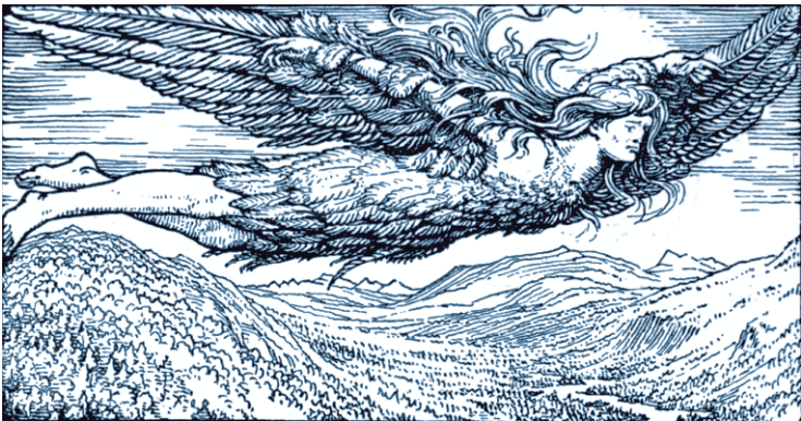
Полет Локи в Етунхейм. У. Г. Коллингвуд, 1908 г.

Однако в мифах эта мечта отражалась специфически, и превращение если и происходило, то редко было человеку во благо. В большинстве случаев он менял облик не по своему желанию, а по произволу какой-то сверхъестественной сущности: бога, демона или сильного колдуна. Причем согласия человека на это не требовалось. Так, колдунья Цирцея (Кирка) превратила в свиней спутников Одиссея; Ио была превращена в корову Зевсом, который хотел спасти любовницу от преследований жены. Правда, не слишком успешно. Афина из зависти превратила искусную ткачиху Арахну в паучиху. А первым волком-оборотнем, согласно