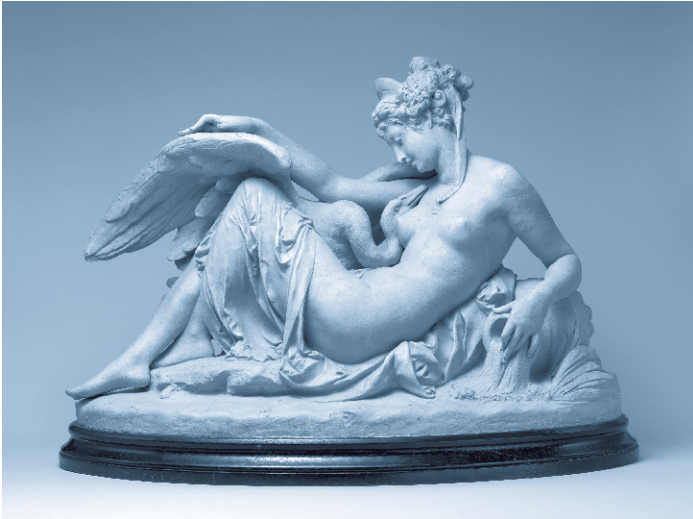
Зевс в образе лебедя соблазняет Леду. Альбер-Эрнест Каррье-Беллэз, ок. 1870 г.

Принимали звериный облик и боги других народов. Например, хитроумный Локи (полубог-полувеликан) из скандинавских мифов мог превращаться в волка, ворона, лосося, муху, а обернувшись кобылой, даже родил чудесного восьминогого коня Слейпнира, на котором стал ездить верховный бог Один.