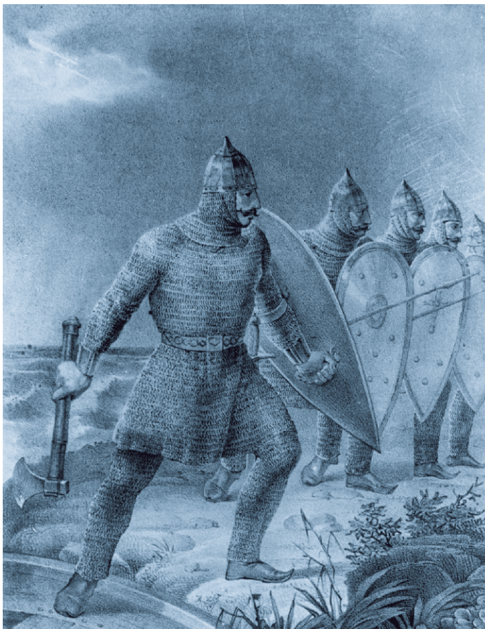
Русское вооружение в X и XI столетиях. Пешие воины

Волх — явно другой персонаж, потому что в былинах о Вольге не сказано ничего о его чудесном рождении, тогда как Волх — по легенде, сын змея и княжны Марфы Всеславьевны, которая, гуляя по саду, на этого змея случайно наступила и «понесла», а потом родила богатыря. Возможно, официальным отцом Волха был «рожденный от волхования» 37 князь