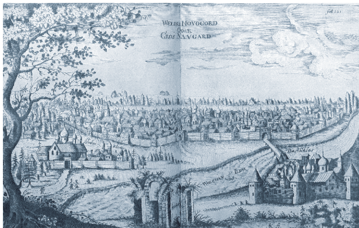
Великий Новгород. Гравюра Адама Олеария, 1656 г.

изысканиям В. Н. Татищева. Впрочем, Словен и Рус упоминались и в более древних источниках, в том числе арабских.