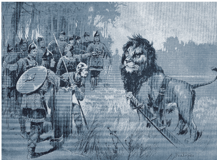
«Обернулся львом Всеславьевич».

Иллюстрация к книге «Про богатырей древне-киевского периода», 1894 г.