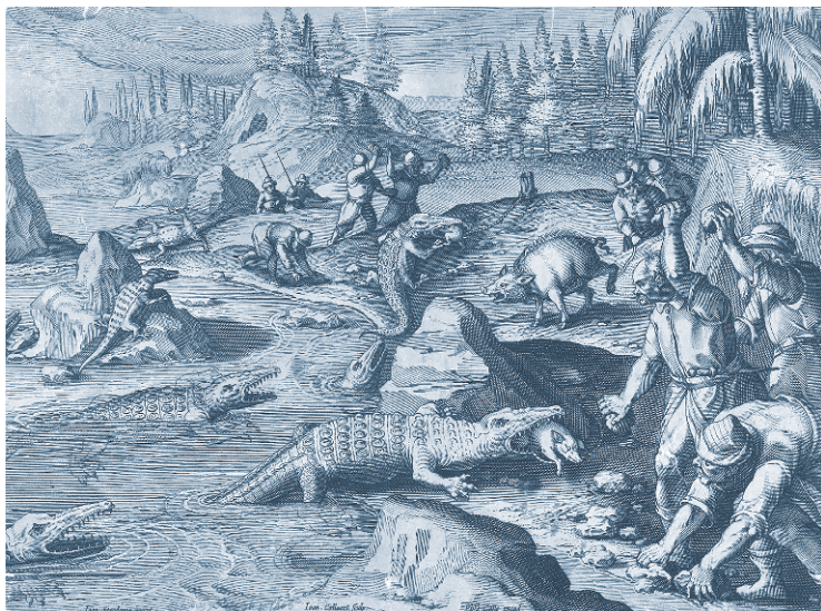
Крокодилы в Европе. Гравюра Яна Калларта

знают. Так бы сейчас воспринималась заметка о нашествии колорадских жуков. И, кстати, примерно к тому же времени относится западноевропейская гравюра, на которой изображена схватка людей и крокодилов, напавших на скот. Причем действие происходит на фоне явно не тропического пейзажа.