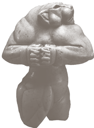
Антропоморфная скульптура, львица Гуэннола, ок. 3000–2800 гг. до н. э.

Также хочу выразить большую признательность издательству «Манн, Иванов и Фербер» за то, что данный труд воплотился в жизнь.