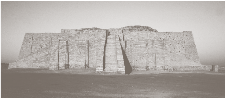
Руины зиккурата — многоступенчатого культового сооружения — в Уре

В середине III тыс. до н. э. юг Месопотамии подчинили себе аккадские племена. В отличие от шумеров, чей язык не имеет аналогов в современном мире, народ завоевателей говорил на языке семитской группы (в нее также входят, например, арабский и еврейский языки). Аккадцы дали местным божествам семитские имена, но, кроме того, принесли с собой и собственных богов, которые вошли в шумерский пантеон на правах второстепенных. Так, бог мудрости Энки получил имя Эа, бог солнца Уту стал Шамашем, а богиня войны и любви Инанна стала называться Иштар.