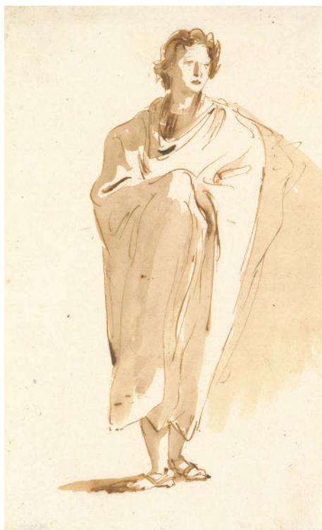
Джованни Баттиста Тьеполо. Стоящая фигура юноши. Ок. 1755–1760

В середине XIX века рисунок и графика окончательно выделились в самостоятельный вид искусства. Наброски пейзажей, портретов, фигур, интерьеров стали считаться полноценными произведениями, не предполагающими завершения или продолжения найденной темы в другой технике. Это привело к большому многообразию стилей, индивидуальных пластических и технических находок, интонаций. Стало не так важно, что именно нарисовано, важно — как. Благодаря этому в XX веке появилось множество художников, для которых натурный рисунок фигуры человека стал одной из основных тем творчества. Можно вспомнить Густава Климта, Эгона Шиле, Огюста Родена, Владимира Лебедева, Николая Тырсу, Бориса Григорьева, Ричарда Дибенкорна, Герхарда Маркса, Георга Кольбе, Дэвида Хокни, Дмитрия Кардовского и многих других.