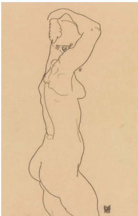
Эгон Шиле. Стоящая обнаженная, вид справа. 1918