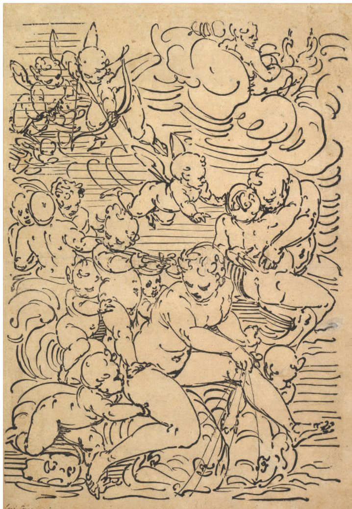
Лука Камбьязо. Триумф духа. Ок. 1550–1580

Роль и выразительные средства наброска менялись вместе с тем, как эволюционировали задачи и возможности художника. Чем больше становилось пространства для личного высказывания, тем больше ремесленную работу художника по копированию действительности дополняла его собственная трактовка композиции и пластики. Нередко набросок или эскиз к картине получались более тонкими по интонации и образу, чем готовые произведения. Причина тому — непосредственность фиксации ощущений и мыслей автора на бумаге при быстром рисовании. Динамика линии, текстура пятна, нажим — все это появляется на листе одновременно и делает изображение живым, подвижным. Хороший набросок всегда сохраняет в себе ощущение сиюминутности, конкретного момента.