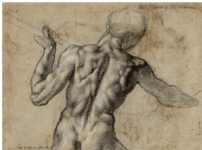
Микеланджело Буонарроти. Обнаженный мужчина со спины. Этюд солдата с копьем для фрески «Битва при Кашине». Ок. 1504