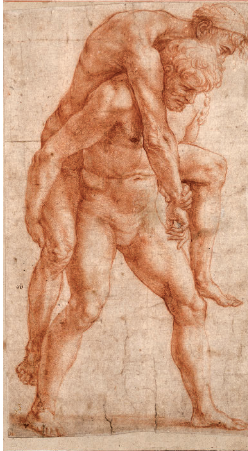
Рафаэль Санти. Молодой мужчина, несущий старика на спине. Этюд для фрески «Пожар в Борго». Ок. 1514