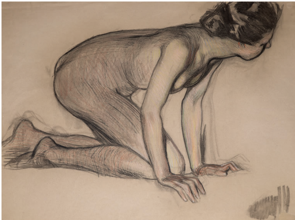
Дмитрий Кардовский. Натурщица. К картине «Самсон и Далила». 1902