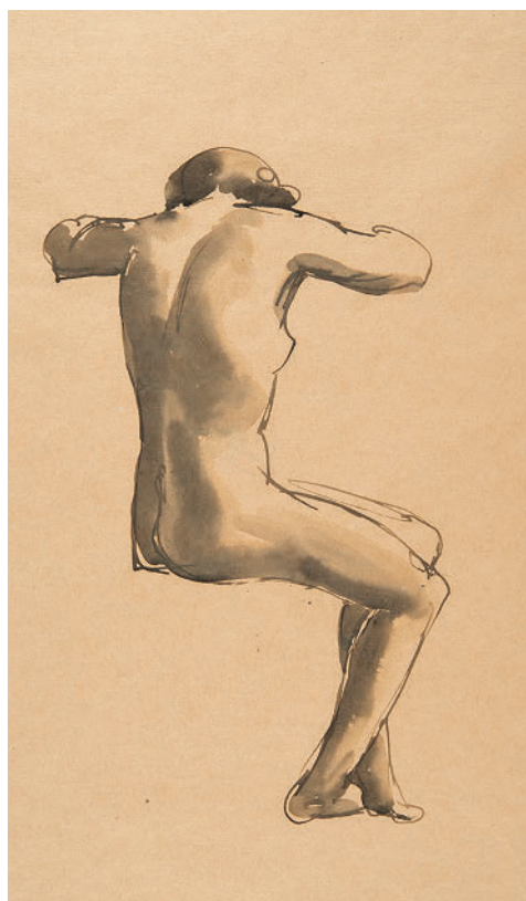
Георг Кольбе. Сидящая (набросок). 1913–1916