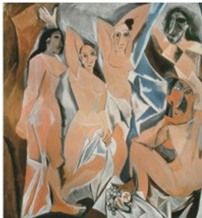
Центр управления полетами NASA и «Авиньонские девицы» Пикассо

Что общего между двумя этими историями? На первый взгляд, немного. Спасение «Аполлона-13» было совершено коллективным усилием. Пикассо творил в одиночку. У инженеров NASA счет шел на часы. Пикассо потратил несколько месяцев на воплощение замысла и показал свое творение миру спустя почти десятилетие. Специалисты NASA не гнались за оригинальностью: они должны были сделать то, что принесет результат. «Практичность» — последнее, о чем думал Пикассо: его цель заключалась в том, чтобы создать нечто, не имеющее аналогов.