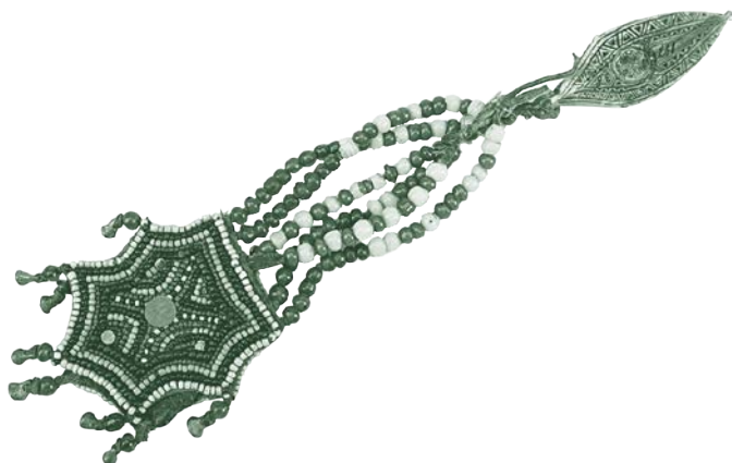
Серница с прикрепленным к ней мешочком для трута. Тунгусы, ламуты. Россия, Якутия (Саха). 1880–1886 гг.

где главная цель — выявить и показать истинную, глубинную красоту самого материала, сохранив его изначальную сущность и самобытность. Работая над книгой, я по возможности стремилась именно к этому и очень надеюсь, что хотя бы отчасти мне это удалось.