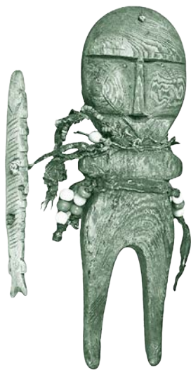
Изображение духа — покровителя семьи. Эвенки. Россия, Красноярский край, Туруханский р-н (Туруханский край), конец XIX в.

Книги серии «Мифы от и до» относятся к научно-популярному жанру, однако мифология, по сути, находится на стыке науки и искусства: мифы содержат в себе огромное количество информации об истоках мировоззрения, общественных отношениях,