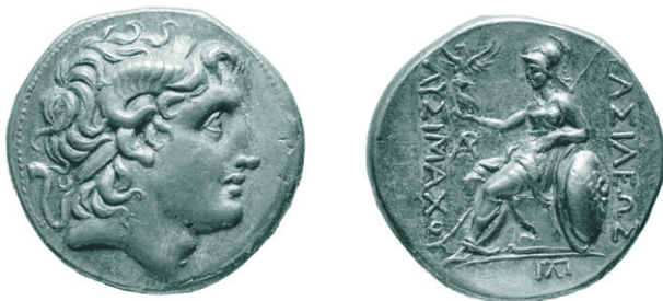
Серебряная тетрадрахма с головой Александра Македонского и Афиной на реверсе. Ок. 297–281 г. до н. э.

Похожая ситуация сложилась и со сказаниями шумеров. Когда юг Месопотамии подчинили аккадские племена, они дополнили шумерских богов своими, а во II тысячелетии до н. э. на карте Месопотамии появились новые игроки — амореи и ассирийцы, которые в очередной раз приспособили легенды «под себя». Главным героем мифа о сотворении мира вавилоняне «назначили» собственного бога Мардука, которого ассирийцы заменили своим Ашшуром. В принципе благодаря глиняным библиотекам мифы народов Междуречья тоже довольно хорошо изучены. Правда, они известны в основном специалистам — в Месопотамии не оказалось поэтов-популяризаторов, подобных греческим и римским авторам. Как ни крути, отечественная литература все-таки европоцентрична, и сказания Междуречья в большинстве случаев известны нашему читателю разве только по похождениям Гильгамеша, а шумерская легенда о Потопе и спасительном ковчеге и вовсе пришла к нам в библейском пересказе*.