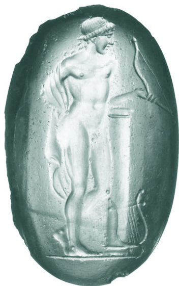
Хризолит из древнеримского кольца с изображением Аполлона. Ок. I в. до н.э. — II в. н.э.

В заключительной части поговорим о верованиях средневековых горняков — какие мифы и герои родились в темных шахтах, как они перешли в сказки, а позже нашли отражение в книгах, фильмах и компьютерных играх. А уж верить или не верить — дело твое, читатель.