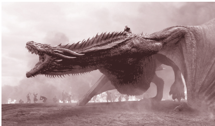
Один из самых знаменитых драконов современности. Кадр из сериала «Игра престолов»

благородных героев), но в азиатском мировосприятии драконы могли быть и уязвимыми жертвами, которые искали союзников среди людей, чтобы сразиться с еще более устрашающим противником. В этих сказаниях драконы могли жить рядом с людьми, превращаться в прекрасных женщин и мужчин и пользоваться всеми благами жизни аристократов. Их привязанность к людям даже приводила к романтическим отношениям.