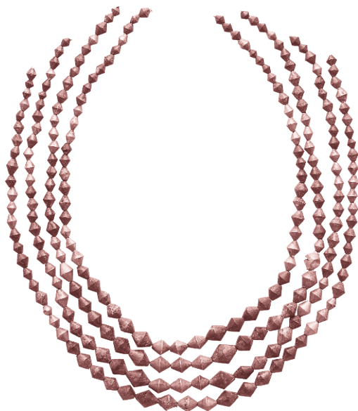
Колье из гробницы в Уре, 3000 тыс. до н. э.

значение имело обеспечение едой и водой. Считалось, что в загробном мире пища, доступная призракам, хуже, и постоянный акцент на этих подношениях отражал сочувственное осознание этой ситуации.