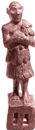
Фигура для передачи образа молящегося, 2500–2350 гг. до н. э.

Накопленные практики и процедуры взаимодействия с призраками тщательно систематизировались в клинописных руководствах с третьего тысячелетия до н. э. Однако большинство текстов дошли до нас в более поздних списках первого тысячелетия до н. э. Магические заклинания перечисляют различные типы людей, которые могли вернуться в виде призрака. Предзнаменования описывают случаи, когда человек видит, слышит, встречается или