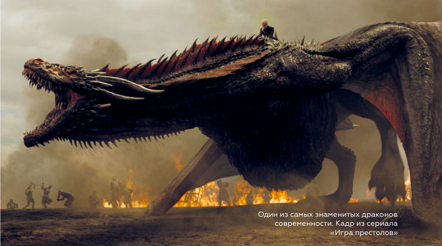
Один из самых знаменитых драконов современности. Кадр из сериала «Игра престолов»

целительными свойствами, но эта тема не получила развития у большинства европейских авторов.