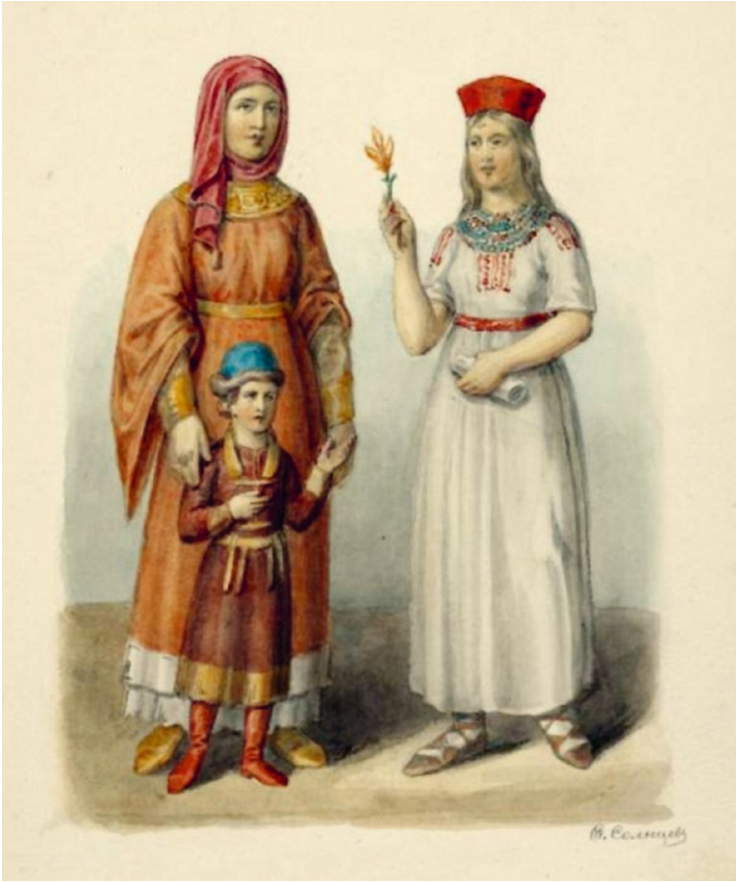
Федор Солнцев. Изборник князя Святослава 1073 г. Одежда великокняжеская. 1820–1869

ее батюшки, где садится на трон — и живет счастливо. То есть ничего не делая.