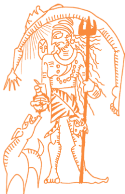
Шива в образе свирепого Бхайравы, несущего труп Сати или Вишваксены (Канкала-мурти), череп Брахмы или Дакши (Капалика-мурти), просящего подаяние со своей собакой (Бхикшатана-мурти)

и благословения для живых. В тантрических преданиях считается, что колдуны могут поработать злых духов (ветала) при помощи тайных ритуалов (шава-садхана), в которых в качестве магических предметов используются плоть, кости и череп мертвеца. Чтобы это предотвратить, следовало позволить брахманам выполнить ведийские ритуалы, связанные со смертью: полностью уничтожить труп, разбив даже его горящий череп, чтобы дать умершему возможность отправиться в страну мертвых, после чего его следовало регулярно кормить до тех пор, пока не придет время возрождения.