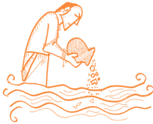
Погружение праха и костей умершего в реку в надежде на его последующее новое рождение и освобождение

Концепция вечного возвращения закладывается в сознание индуистов через ритуалы и истории. В ведийские времена после яджны алтарь сжигали (что перекликается с обрядом похорон), а затем восстанавливали его из новых кирпичей. Сегодня праздники в честь Ганеши и Дурги отмечаются в течение десяти дней и девяти ночей, чтобы напомнить нам о десяти лунных и девяти солнечных месяцах беременности. После праздника глиняные фигурки божеств бросают в водоемы так же, как прах умерших. Таким образом, даже боги не вечны и преходящи. Они уйдут в этом году, но вернуться в следующем, воспроизводя мотив повторяющейся смерти (пунар-мритью) и возрождения (пунар-джанма), упомянутых в упанишадах.