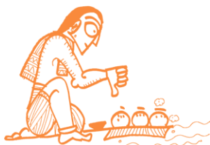
Пинда-дана, ритуал кормления предков

Конечно, не все индуисты соблюдают эти обычаи и ритуалы. Индуизм разнообразен, динамичен и сложен. Но доминирующее в нем понимание смерти пришло к нам из Прета-кальпы в «Гарудапуране», которая была написана тысячу лет назад и которую до сих пор читают во время погребальных церемоний. Ритуал шраддхи, включающий в себя подношение пинды предкам, восходит к «Грихья-сутрам»*, которым более двух с половиной тысяч лет, что указывает на примечательную преемственность данной традиции. Слово «питар», обозначающее предков, появляется в «Ригведе», старейшем священном писании тексте в индуизме.