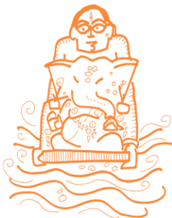
Висарджана — погружение в воду глиняных изображений божеств после церемониального поклонения

Еще одной отличительной особенностью восприятия смерти в индуистском мировоззрении является ее связь с чем-то нечистым. Если движение по часовой стрелке соотносится с богами, то движение против часовой стрелки связано с предками. Посетившим крематорий запрещается входить в дом, пока они не совершат омовение. Те, кто из поколения в поколение занимался подготовкой и обслуживанием погребальных костров, считались неприкасаемыми. Именно эта концепция неприкасаемости некоторых людей придавала окончательный вид ныне незаконной кастовой иерархии. Для женщин дела обстояли не лучше: считалось, что к женщинам во время «критических дней» и к вдовам притронулась смерть, и поэтому их изолировали от общества.