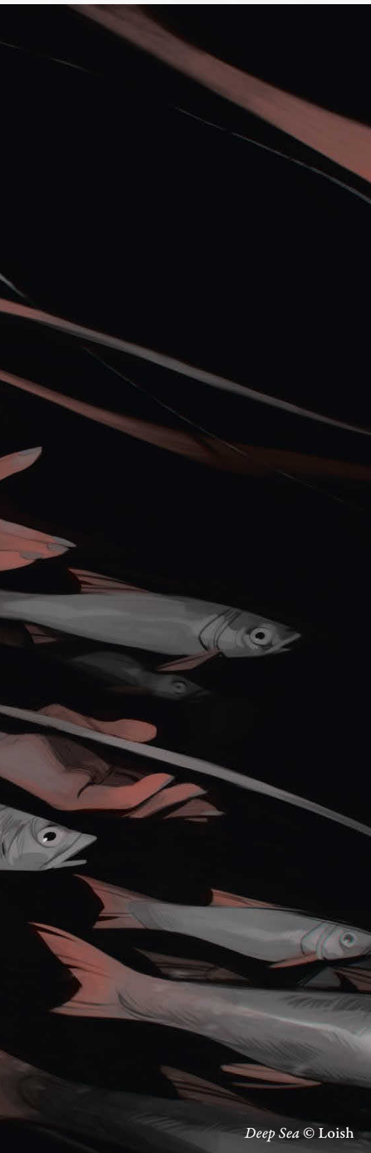
Deep Sea © Loish

Когда я впервые увидела творчество Элизы, то была очень впечатлена его оригинальностью и изысканностью. Ее наброски и картины не только отражали ее безграничный талант и мастерство, но и были поэтичны и выразительны. Я буквально оцепенела. Это те произведения искусства, которые тем интереснее, чем дольше вы их разглядываете. Новые детали раскрываются по мере того, как глаза следуют за движением линий и цветов. Я тоже художник, и первый вопрос, который я себе задала, был: «Как?»