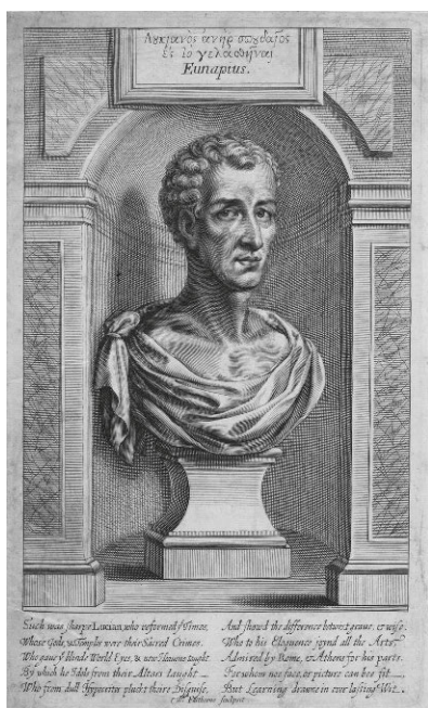
Уильям Фэйторн, «Лукиан Самосатский» (1711)

и богинях — во всяком случае, это справедливо, когда мы говорим о Европе. Например, именно так обстоит дело с древнегреческой мифологией. Но проблема в том, что все известные нам кельтские мифы — продукт христианской эры: они были записаны в Средние века или даже позже. Архаические кельтские легенды, в отличие от греко-римских, не сохранились в том виде, в каком их рассказывали до прихода христианства люди, поклонявшиеся древним божествам. Конечно, это не означает, что у древних племен, говоривших на кельтских языках, не было богатой мифологии: безусловно, она существовала. Но до нас не дошла, потому что в те века никто не записывал истории, а если и записывал, то документы эти не сохранились.