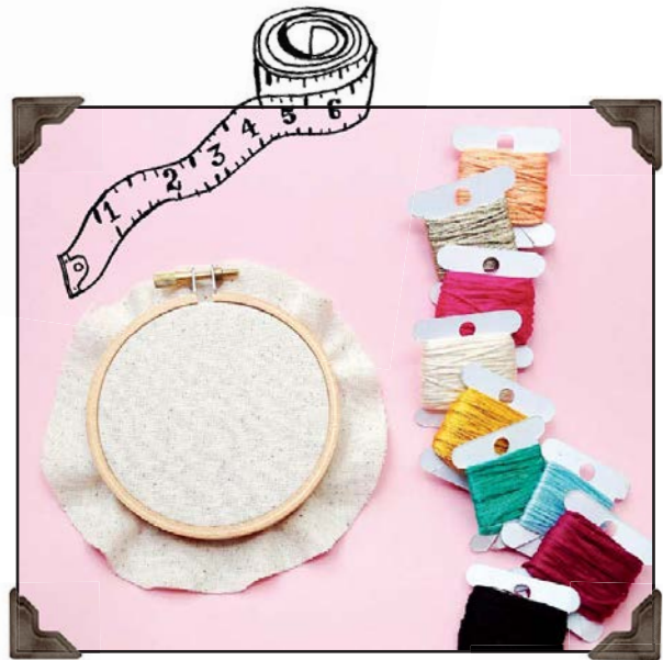
Мои любимые вещи...