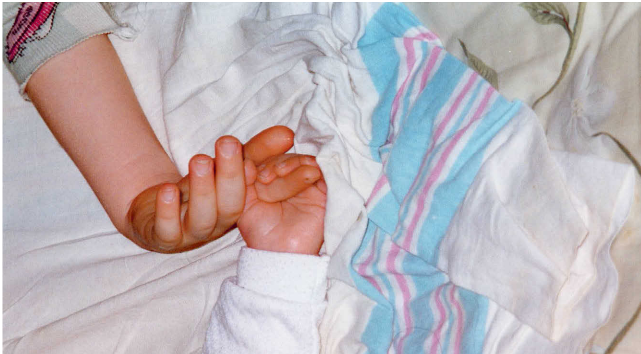
Мой старший брат Финнеас. Мы сразу стали лучшими друзьями