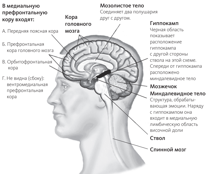
СХЕМА ГОЛОВНОГО МОЗГА В БОКОВОЙ ПЛОСКОСТИ

Сотни миллионов лет назад ствол представлял из себя то, что некоторые называют мозгом рептилии. Ствол получает сигналы от тела и отправляет их обратно, тем самым регулируя базовые процессы жизнедеятельности, например работу сердца и легких. Он также обуславливает запас энергии участков мозга, расположенных выше, — лимбической доли и коры головного мозга. Ствол напрямую контролирует состояние возбуждения, определяя, например, голодны мы или сыты, испытываем сексуальное желание или удовлетворение, спим или бодрствуем.