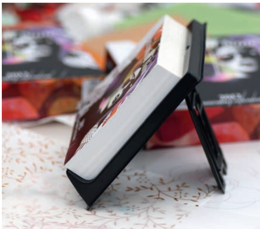
Публикация иллюстраций в календаре издательства Taschen