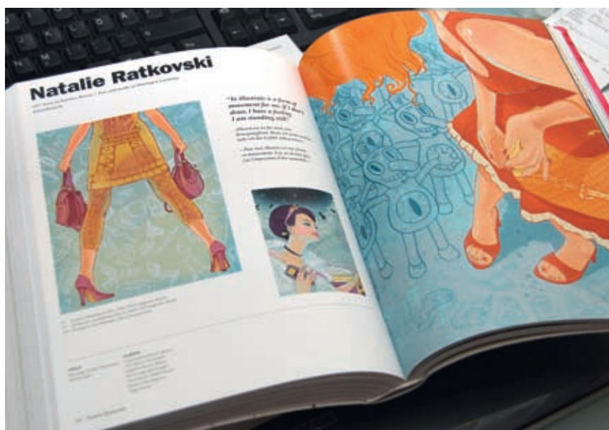
Публикация работ в сборнике Illustration Now! издательства Taschen