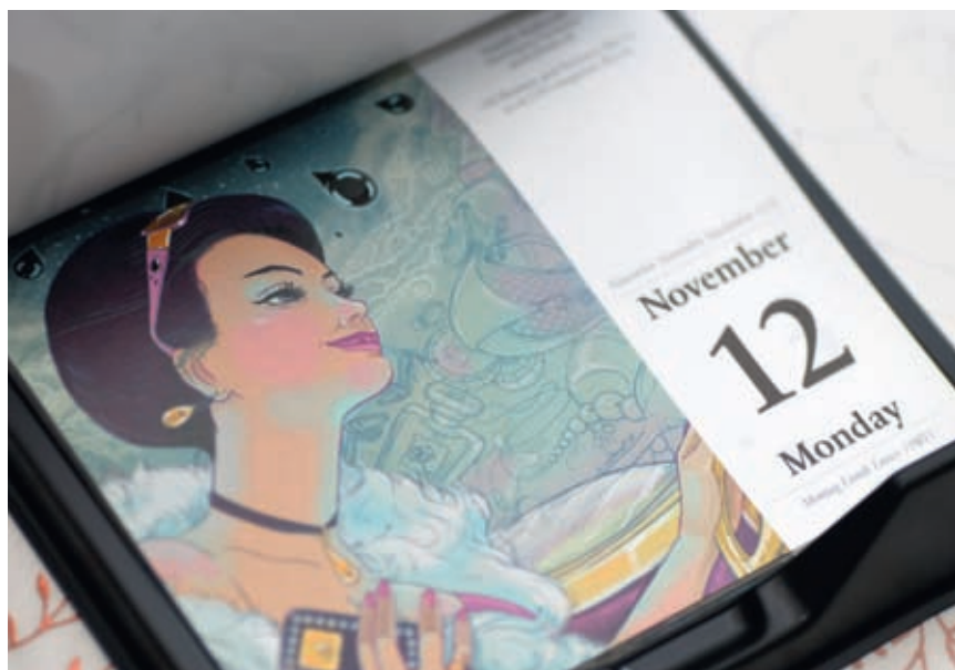
Публикация иллюстраций в календаре издательства Taschen

учебного заведения): «Конечная цель всякого художественного творчества — созидание. Мы все — архитекторы, скульпторы, живописцы — должны вновь вернуться к ремеслу... Не существует принципиального различия между художником и ремесленником. Художник — ремесленник более высокого класса... Он не может обойтись без ручного труда. Для него это источник творческих сил»*.