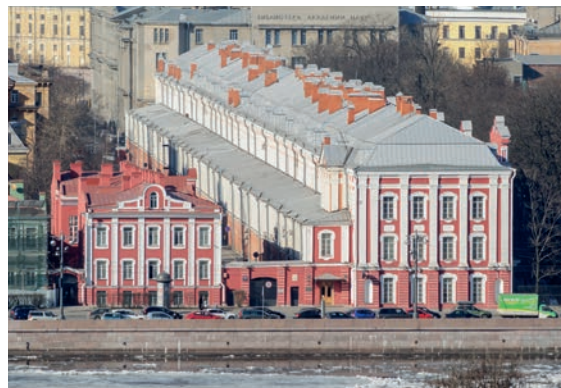
Кунсткамера. Кабинет редкостей в стиле петровского барокко (1718–1734) смотрит на Неву главным фасадом (слева), здание Двенадцати коллегий выходит к реке боком (справа).