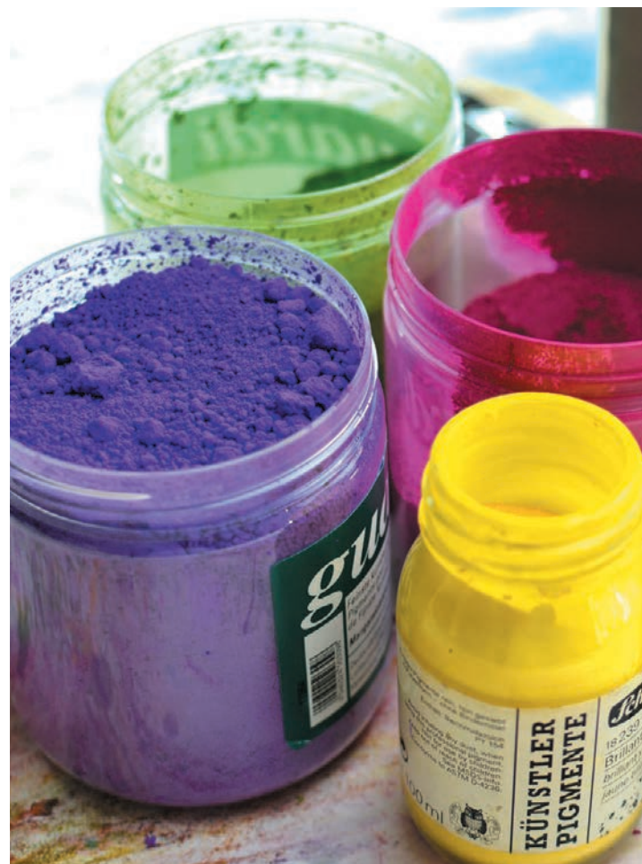
Пигменты и связующее вещество — компоненты акриловой краски

Связующее вещество — своего рода клей, который удерживает частицы пигмента вместе и не дает краске отстать от холста. Для акриловых красок была синтезирована смола, которая по своим свойствам мало чем отличается от древесной. Натуральная смола очень клейкая, пристает к любой нежирной основе и чересчур эластична. Акриловая же нетоксична, не теряет свойств со временем и не желтеет.