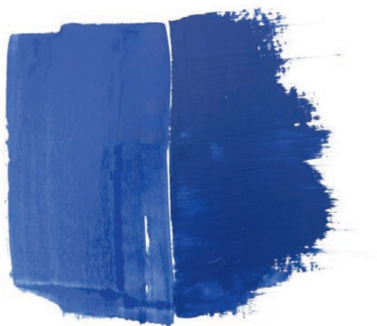
Цвет при нанесении — цвет после высыхания

У быстрого высыхания акриловой краски, как и у медиалы, две стороны. С одной стороны, это позволяет наносить слои друг поверх друга без долгого ожидания, с другой — затрудняет смешение непосредственно на холсте и не дает возможности сделать плавный переход цвета.