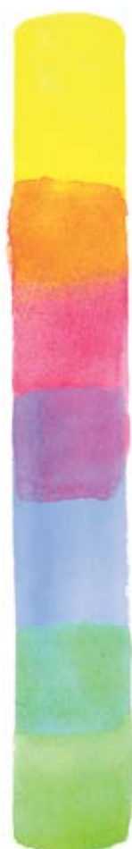
АУРЕОЛИН ЖЕЛТЫЙ (AY)*

Здесь показаны чистые пигменты, которые я обычно использую. Все они прозрачны и прекрасно смешиваются: это видно там, где они перекрываются. Не нужно груд тюбиков с краской. Все цвета есть на вашей кисти, достаточно их смешать.