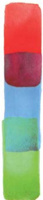
АЛИЗАРИН, ИЛИ КРАПЛАК КРАСНЫЙ (КЛ)

Используйте эти пигменты для создания глубоких темных оттенков. Разбавляйте их для освещенных объектов или для замесов с базовыми прозрачными пигментами.