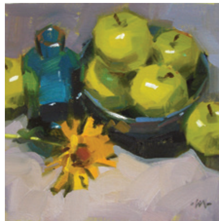
Королевская процессия. 2010. Масло, деревянная панель. 15 × 15 см.