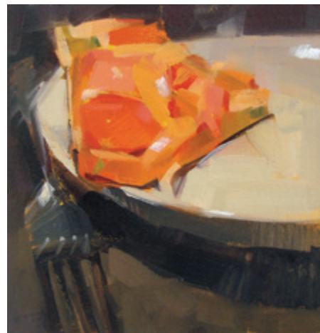
Завтрак. 2009. Масло, деревянная панель. 15 × 15 см.

В этот сайт мы вложили все, что я вынесла из своих занятий ежедневной живописью, все идеи, как сделать его работу успешной. Хотя там нет жюри, у нас замечательное сообщество художников, и каждый волен делиться своими комментариями так часто, как того пожелает. Что бы участники ни выложили в своем блоге, это автоматически будет отображаться на первой страничке Daily Paintworks в течение одного дня (а в архиве останется навсегда) со ссылкой для покупателя, возможностью посмотреть картину в увеличенном виде и найти ее в списке картин в персональной галерее художника. Мы также придумали дополнительные инструменты, такие как «картина недели», ежемесячный конкурс, место для обмена критическими суждениями, возможность давать и получать комментарии, сетку для отслеживания продаж и непроданных картин, онлайн-раздел обучения под названием «Артбайты» и многое другое.