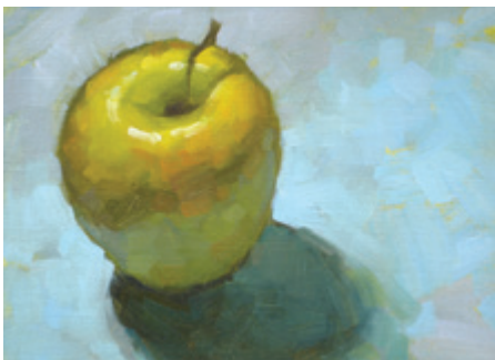
Яблоко . 2006. Масло, бумага. 15 × 20 см. Моя первая «ежедневная» картина.

Дузэйна считают родоначальником ежедневной живописи.