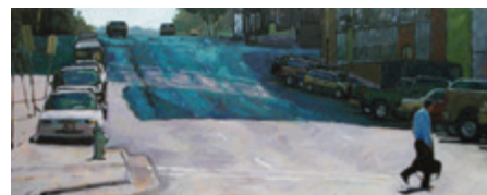
Голубой понедельник. 2004. Масло, холст. 56 × 162 см. Одна из моих первых галерейных картин, на которой изображен центр Остина. В то время я писала много городских пейзажей.

Розовый цветок в банке. 2004. Масло, холст. 86 × 102 см.