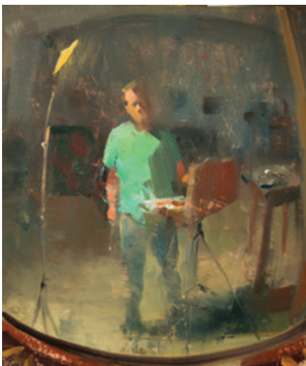
Дузэйн Кайзер. Автопортрет в выпуклом зеркале . 2013. Масло, бумага. 15 × 20 см.

Дузэйна считают родоначальником ежедневной живописи.