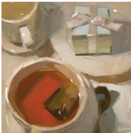
Сюрприз. 2012. Масло, деревянная панель. 15 × 15 см.

Угроза. 2011. Масло, деревянная панель. 15 × 15 см.