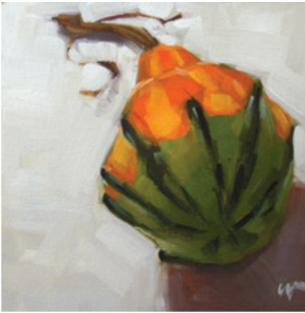
Вот так тыква! 2007. Масло, деревянная панель. 15 × 15 см.

К этому времени многие художники присоединились к движению «ежедневной живописи», создавая блоги на бесплатном ресурсе Blogger (blogger.com), где все желающие могут обсуждать картины. На сегодняшний день сформировалось (и продолжает расти) огромное сообщество «ежедневных» художников. В то время как большинство художников считает свою работу