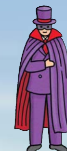
Мистер Икс неуловимый вор