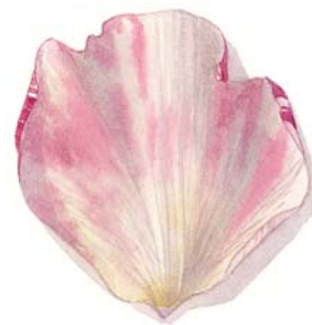
На странице напротив: Анемоны на тонированном чаем фоне

Звучит страшновато, но это не так. Радуйтесь каждому своему большому успеху и маленьким победам в процессе. Если случайно получится что-то красивое, сохраните это и старайтесь в будущем повторить удачный прием.