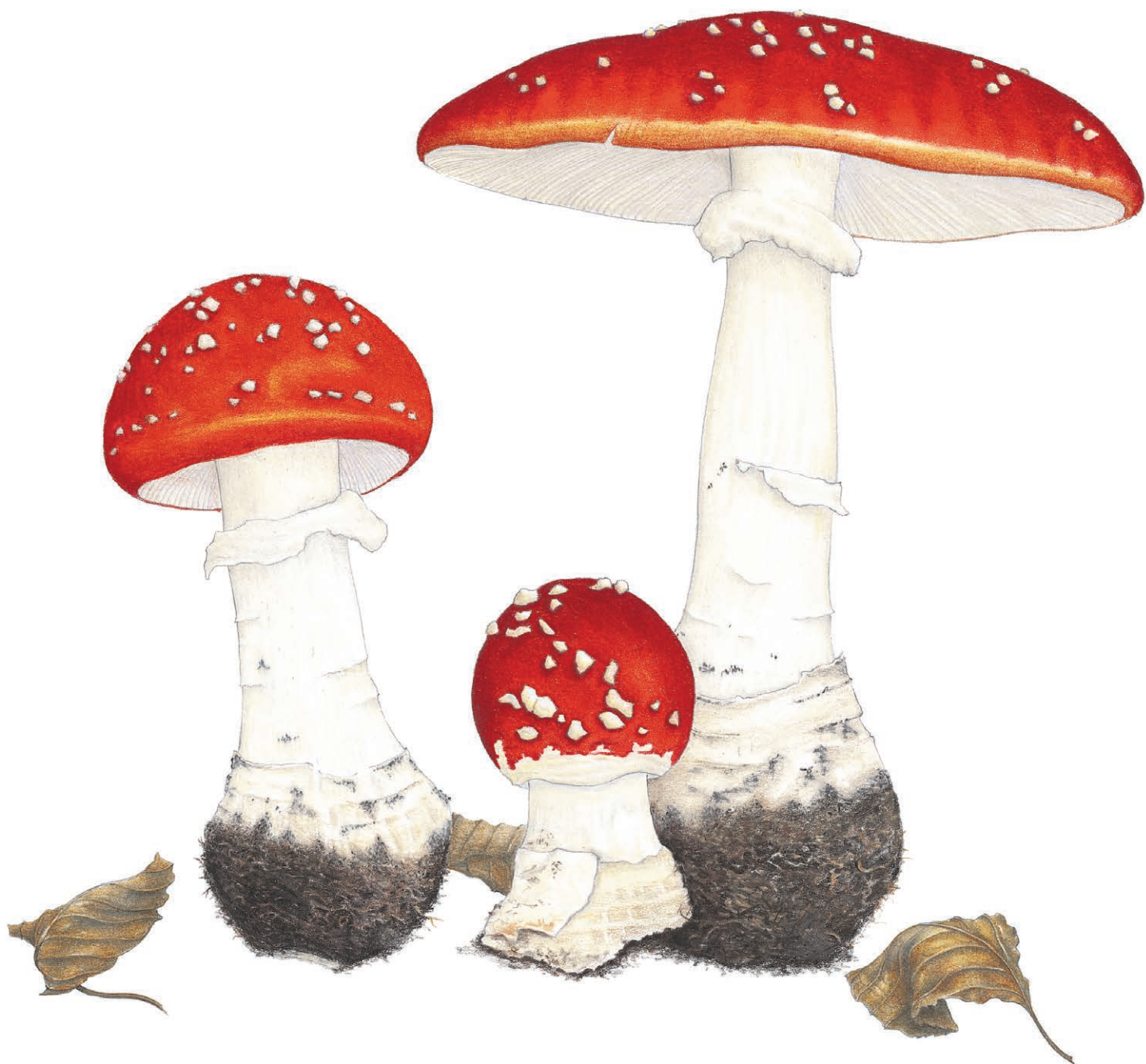
Три красных мухомора Amanita muscaria 25×28 см