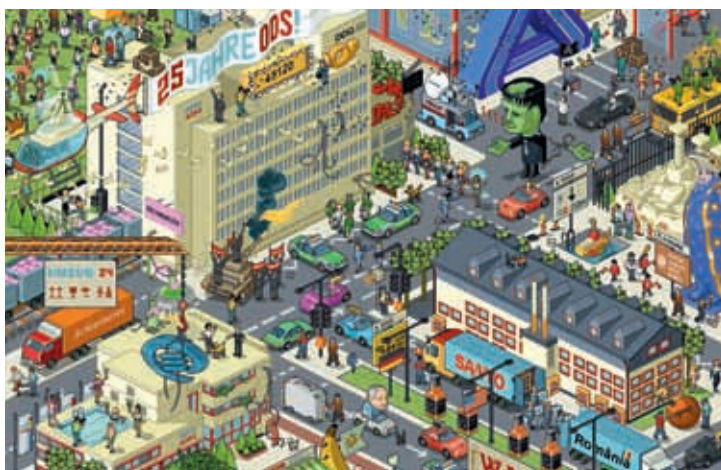
Плакат на юбилей фирмы

Так выглядит результат, на который у меня ушел почти месяц работы по пять-шесть часов в день.