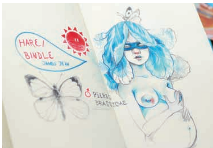
Рисунок по мотивам работы Hare/Bindle американского иллюстратора Джеймса Джина (James Jean)

меня настоящим источником вдохновения. Во-первых, в голове освобождается место для новых идей, во-вторых, уже записанные идеи можно использовать вторично: когда-нибудь они обязательно станут творческим импульсом для новых проектов.