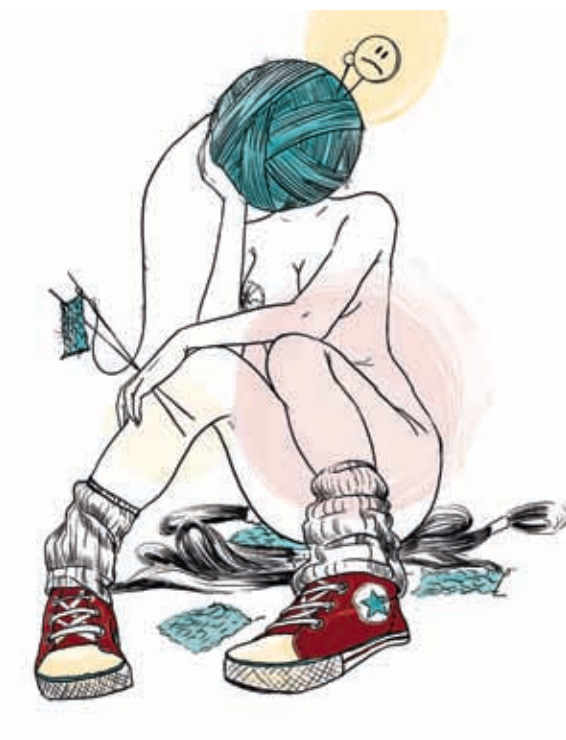
В оригинальной иллюстрации Джеймса Джина девушку-капусту поедает кролик, которого она держит на руках. По такой же схеме выстроен сюжет моей иллюстрации — с той разницей, что голову «расходует» сам персонаж