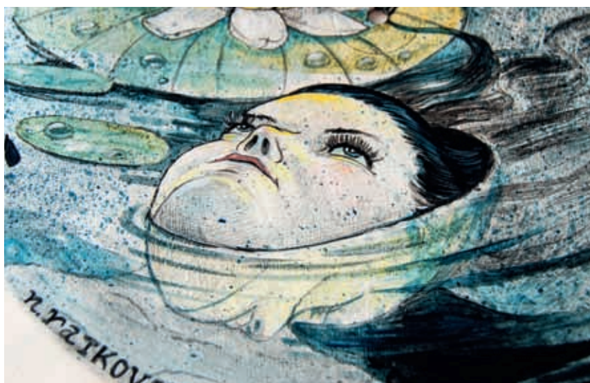
Фрагменты работы для выставки современного искусства в Риме Vinyl Factory, 2009