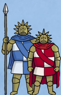
Двое в железных масках