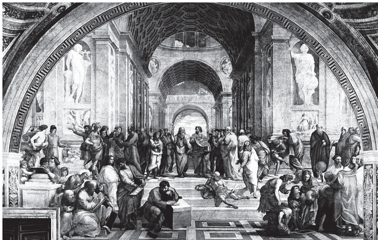
Афинская школа. Рафаэль Санти, 1511

основоположником материализма, сдерживая порыв учителя, делает ладонью придавливающий жест, как будто призывая держаться ближе к земным проблемам.