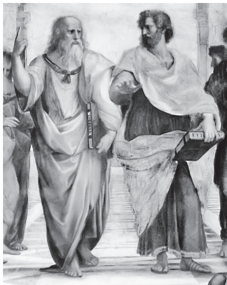
Фрагмент фрески «Афинская школа»

Между прочим, этот человек тоже присутствует на фреске Рафаэля. Он стоит в стороне и что-то втолковывает прислонившемуся к стене и явно озадаченному его словами красивому юноше. На центральные фигуры этот старик не обращает никакого внимания. В нем нет ничего монументального. Он лысоват, сутул, плохо одет и явно не достоин занять место рядом с величественными «отцами» идеализма и материализма. Да он на это и не претендует. Хотел того Рафаэль или нет, но он верно ухватил самую суть этого человека, который меньше всего заботился о впечатлении, производимом на окружающих,