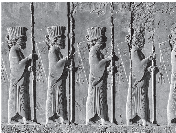
Фрагмент барельефа «Персидские воины», Персеполь

чтобы «окончательно решить греческий вопрос»: завоевать или сделать своими вассалами греческие государства. Как известно, это им не удалось. В так называемых Греко-персидских войнах победу одержали греки, а Персидская империя вскоре сама стала объектом их агрессии и в конце концов была окончательно уничтожена Александром Македонским.