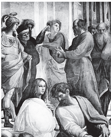
Фрагмент фрески «Афинская школа»

и не претендовал на знание всех тайн Земли и Неба. Больше всего на свете он любил задавать людям вопросы, которые всю жизнь мучили его самого и ответы на которые отыскать не смогли ни Платон, ни Аристотель. Этот старик — Сократ, с чьим именем связано рождение главной, по мнению Аристотеля, из наук: философии.